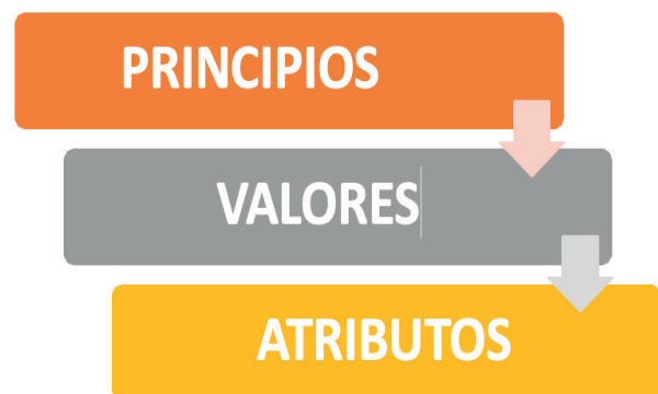
Esquema 1. Contenido del Código Ético Universitario.

El Código Ético Universitario contiene los principios, valores y atributos de conducta en los que se condensa la eticidad institucional como se muestra en los esquemas 1 y 2.