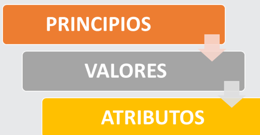
Esquema 1. Contenido del Código Ético Universitario

Son tres los principios que están en la base del Código Ético Universitario: Dignidad Humana, Justicia y Excelencia. Con cada uno de estos principios se asocian valores y atributos.