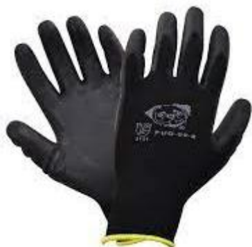
PARTIDA 31.- GUANTES DE POLIESTER