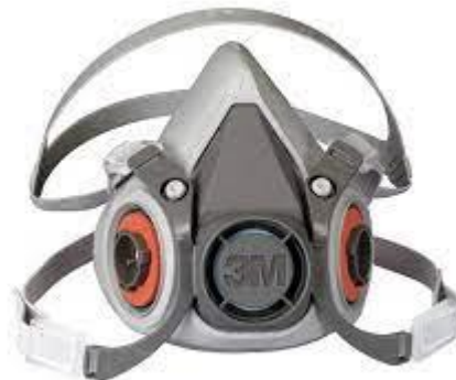
PARTIDA 28.- MASCARA CONTRA GASES