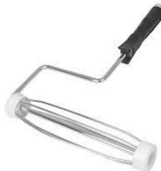
PART. 74 ADHESIVO PARA CONCRETO