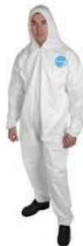
PART. 38 OVEROL DESECHABLE