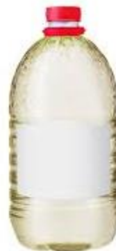
PART. 101 THINNER