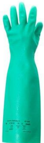
PART. 56 GUANTES SOLVEX 37-185