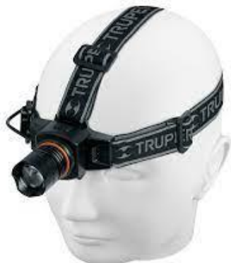
PART. 37 LINTERNA DE MINERO