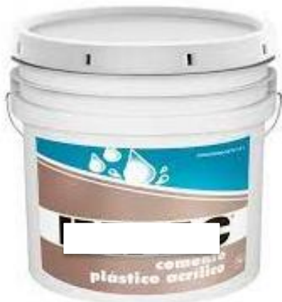
PART. 75 ADHESIVO PARA CONCRETO