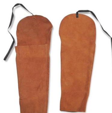
PARTIDA 16.-MANGAS DE CARNAZA