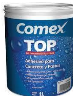
PART. 72 ADHESIVO PARA CONCRETO