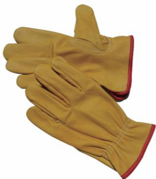
PARTIDA 19.- GUANTES DE PIEL DE OSCARIA ARGONERO