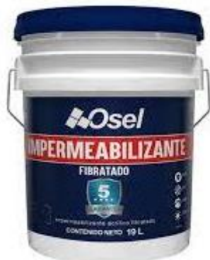
PART. 66 IMPERMEABILIZANTE 5 AÑOS