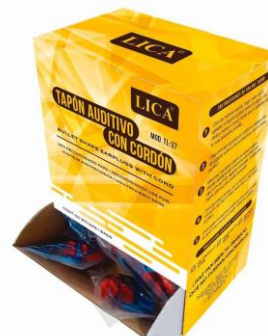
PARTIDA 14.-TAPON AUDITIVO LICA