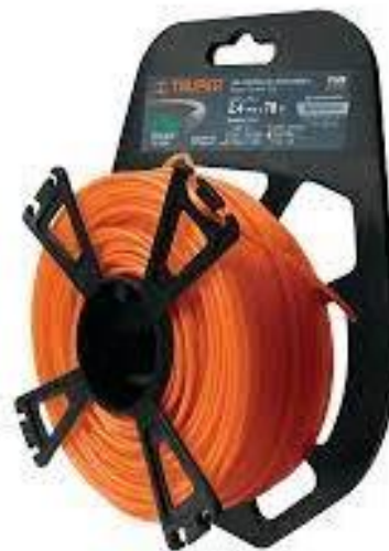
PART. 117 ROLLO DE HILO REDONDO