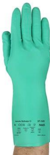
PARTIDA 9.- GUANTES SOLVEX 37-145