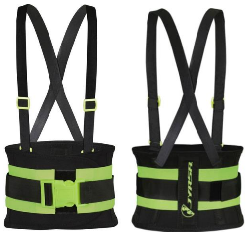
PARTIDA 7.- FAJA JYRSA