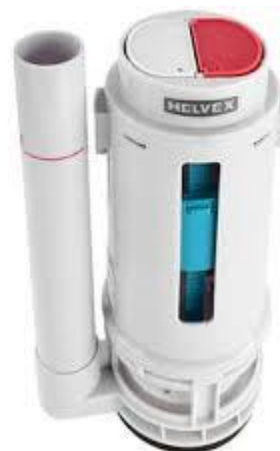
PART. 83 KIT DE VALVULA