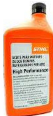
PART. 111 ACEITE STIHL