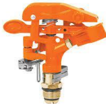
PART. 109 ASPERSOR METALICO