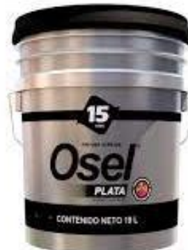
PART. 67, 68 Y 69 VINILICA OSEL