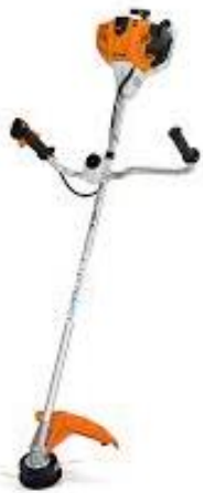
PART. 98 DESBROZADORA STIHL FS 260