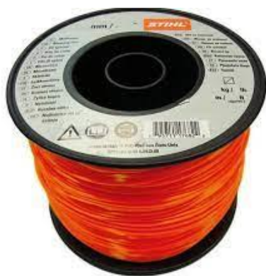
PART. 90 CARRETE DE HILO DE CORTE PARA DESBROZADORA