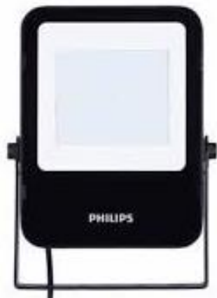
PART. 118 LUM LED PHILIPS