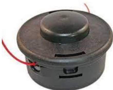
PART. 108 CABEZAL DE CORTE