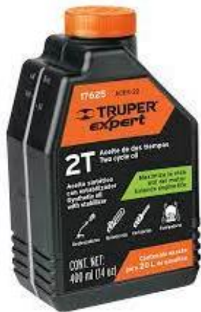
PART. 116 ACEITE SINTÉTICO