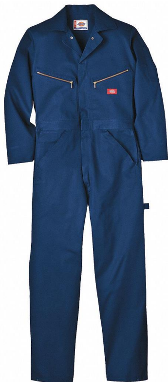
PARTIDA 27.- OVEROL DE MANGA LARAGA