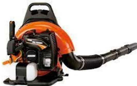
PART. 97 SOPLADORA HUSQVARNA