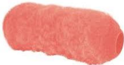
PART. 73 FELPA RUGOSA