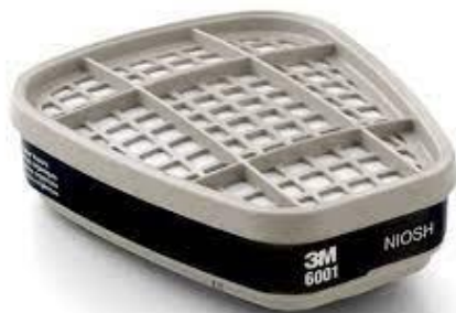
PARTIDA 29.- CARTUCHO PARA VAPOR