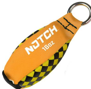
PART. 43 PERA DE LANZAMIENTO