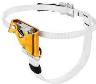
PART. 48 ASENSOR DE PIE DERECHO