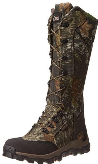
PARTIDA 22.- BOTAS DE CAZA