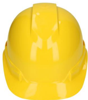
PARTIDA 21.- CASCO CONTRA IMPACTO