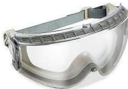
PARTIDA 30.- GOGGLES DE SEGURIDAD