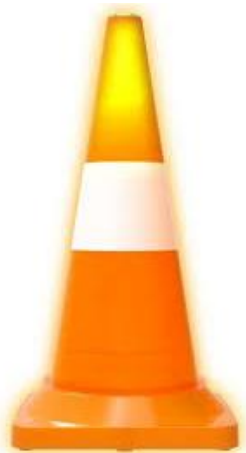
PART. 104 CONO INYECTADO