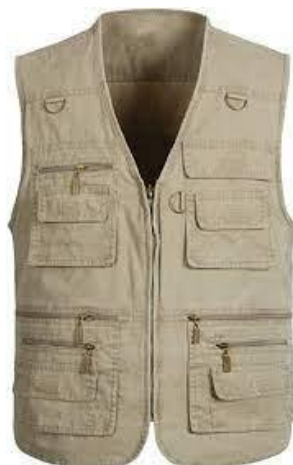
PART. 62 CHALECO TIPO REPORTERO