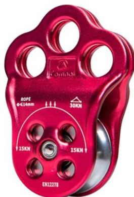
PART. 46 MICROPOLEA TRES