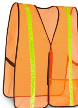
PARTIDA 23.- CHALECO REFLEJANTE