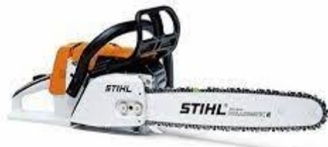
PART. 92 MOTOSIERRA