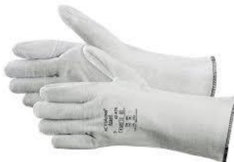
PART. 55 GUANTES PARA TEMPERATURA