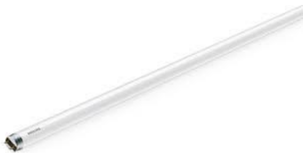
PART. 81 y 82 TUBO PHILIPS