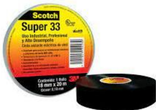
PART. 86 CINTA DE AISLAR