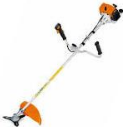
PART. 64 DESMALEZADORA STIHL