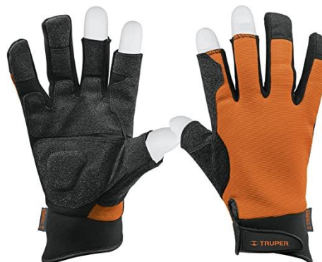
PARTIDA 26.- GUANTES PARA MECANICO