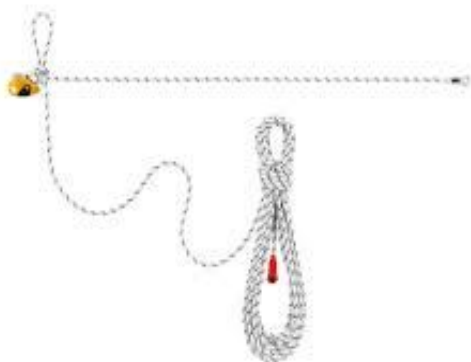
PART. 41 ELEMENTO DE AMARRE