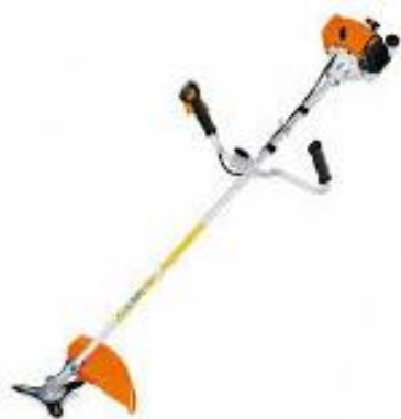
PART. 96 DESMALEZADORA STIHL FS 120