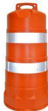
PART. 103 TRAFITAMBOS