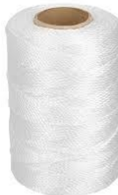
PART. 119 HILO DE PORPILENO