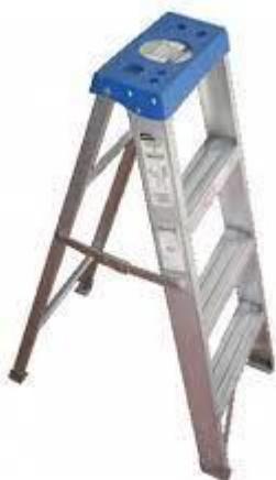
PART. 102 ESCALERA TIJERA