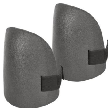
PARTIDA 25.- RODILLERAS DE ESPUMA