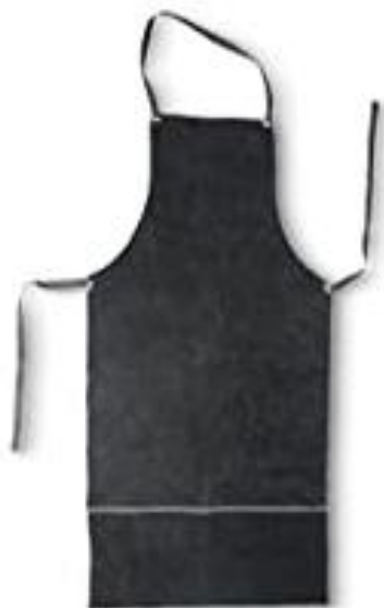
PARTIDA 24.- MANDIL DE CARNAZA CON FORRO DE MEZCLILLA