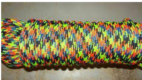
PART. PART. 44 CUERDA PARA