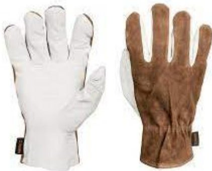
PART. 110 GUANTES DE PIEL DE CABRA