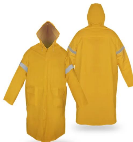
PARTIDA 10.- IMPERMEABLE