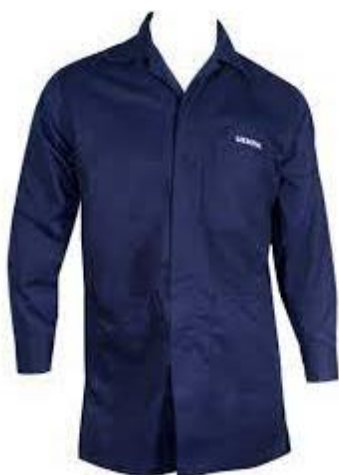
PART. 58 BATA DE GABARDINA