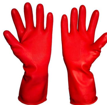
PARTIDA 8.- GUANTES HULTEX