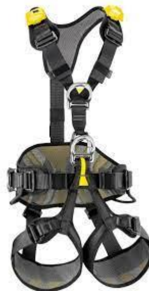
PART. 40 ARNÉS DE CUERPO ENTERO