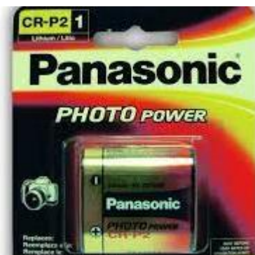
PART. 106 PILA DE LITIO