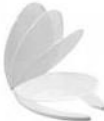
PART. 85 ASIENTO PARA BAÑO