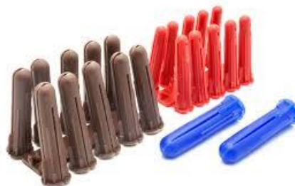
PART. 87, 88 Y 89 TAQUETE