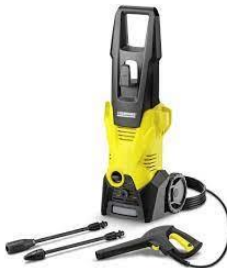
PART. 65 HIDROLAVADORA KARCHER