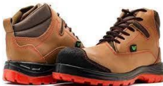
PART. 59 BOTA VANVIEN