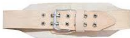
PART. 61 FAJA VAQUETA