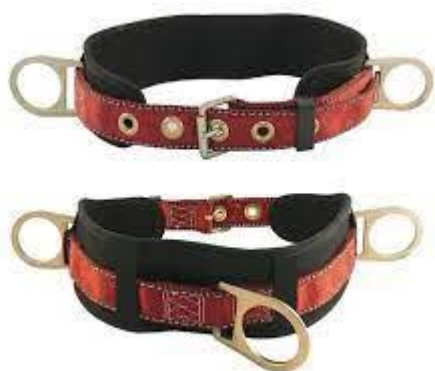
PART. 35 CINTO CON RESPALDO