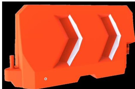
PARTIDA 2.- BARRERA DE TRÁFICO.