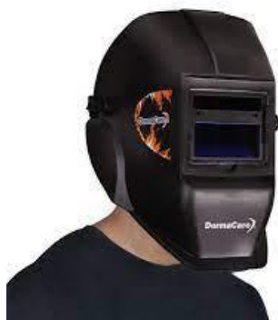
PART. 39 CARETA PARA SOLDAR