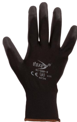
PARTIDA 18.- GUANTE NYLON