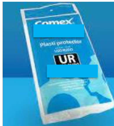
PART. 76 PLASTICO PROTECTOR RUDO