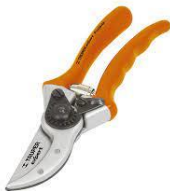
PART. 114 TIJERA PARA PODAR