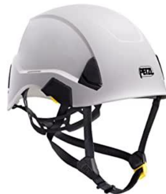
PART. 49 CASCO DE PROTECCIÓN