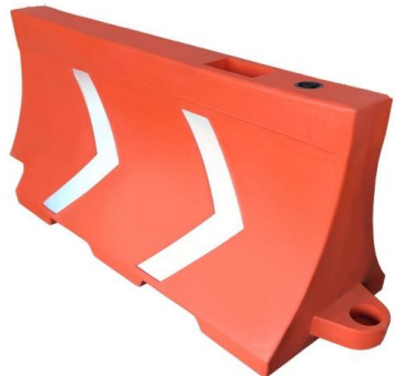
PARTIDA 1.- BARRERA PROTECCIÓN VIAL.