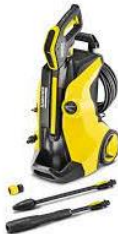
PART. 99 HIDROLAVADORA KARCHER