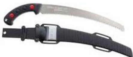
PART. 50 SERROTE CURVO