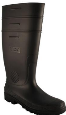
PARTIDA 6.- BOTA HULE LICA