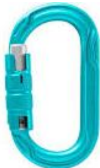
PART. 42 MOSQUETON