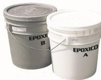
PARTIDA 4 Y 5.- PEGAMENTO EPOXICO PARA VIALETA