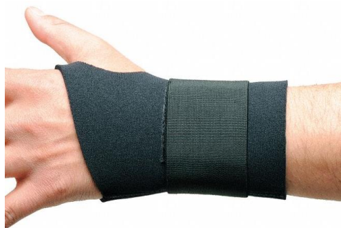
PARTIDA 15.-MUÑEQUERA DE NEOPRENO