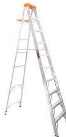
PART. 91 ESCALERA DE TIJERA