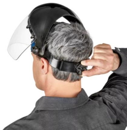
PARTIDA 12.-EQUIPO PARA CABEZA