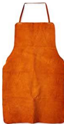
PARTIDA 20.- MANDIL PETO DE CARNAZA