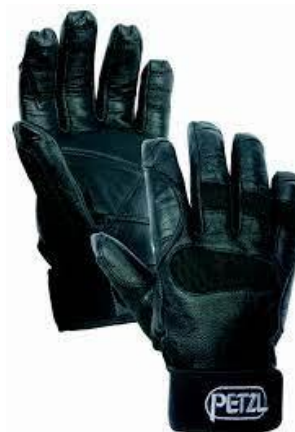
PART. 53 GUANTES PARA PAPEL