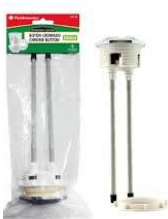
PART. 84 BOTON DE DESCARGA