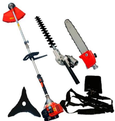
PART. 94 DESBROZADORA POWERCAT