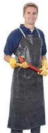
PART. 63 MANDIL DE NEOPRENO