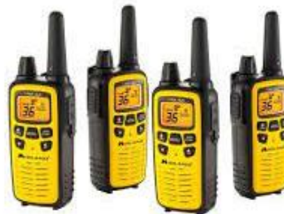
PART 115 RADIO