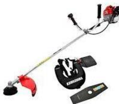
PART. 95 DESMALEZADORA KAWASHIMA