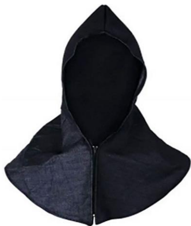
PARTIDA 11.-CAPUCHA DE MEZCLILLA