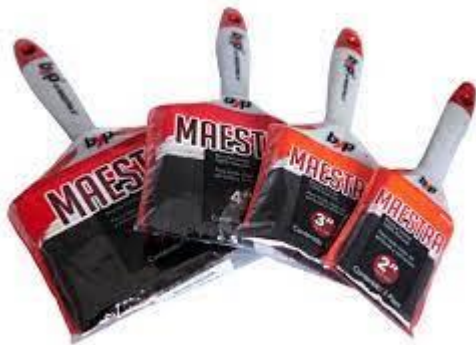
PART. 70 y 71 BROCHAS