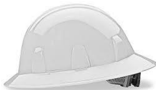
PARTIDA 32.- CASCO DE SEGURIDAD