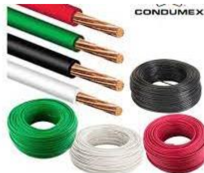
PART. 78, 79, 80 ROLLO DE CABLE CONDUMEX