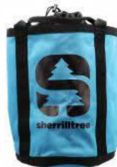
PART. 51 BOLSA PARA CUERDA