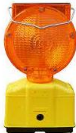
PART. 105 LAMPARA DE DESTELLO