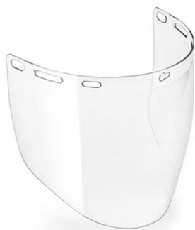
PARTIDA 13.-CARETA DE POLICARBONATO