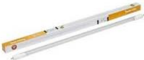
PART. 100 LAMP LED