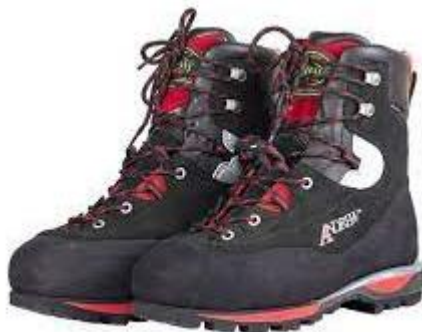
PART. 54 BOTAS ARBPRO