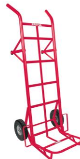
PART. 93 DIABLO DE CARGA