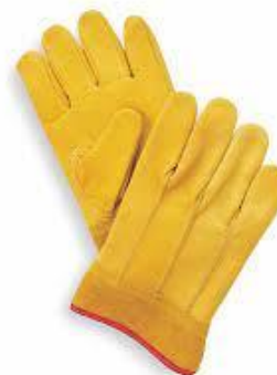
PART. 36 GUANTE PIEL AMARILLO