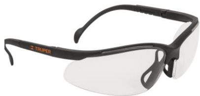
PARTIDA 17.-LENTES DE SEGURIDAD