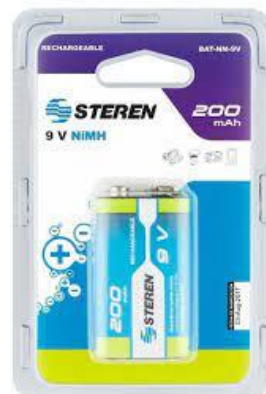
PART. 103 TRAFITAMBOS