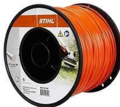
PART. 113 HILO DE CORTE REDONDO