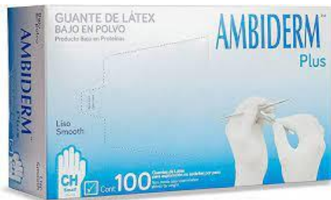
PART. 60 GUANTE LATEX