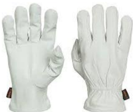
PARTIDA 33.- GUANTES PIEL