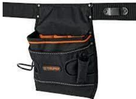
PART. 57 PORTAHERRAMIENTAS