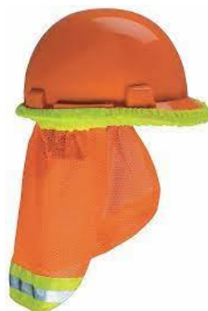
PART. 34 PROTECTOR SOLAR