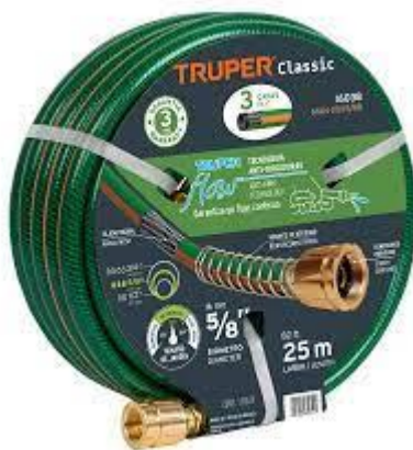
PART. 112 MANGUERA