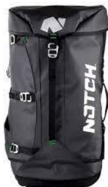
PART. 52 MOCHILA PORTA EQUIPO