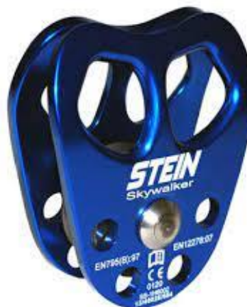
PART. 45 MICROPOLEA DE DOS