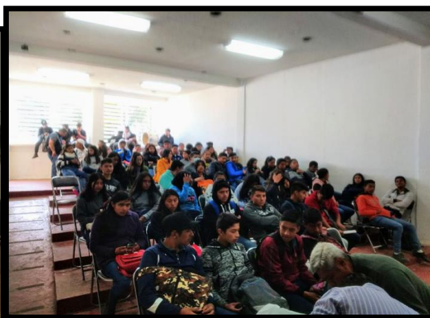
Preparatoria Comunitaria de Tres Marías