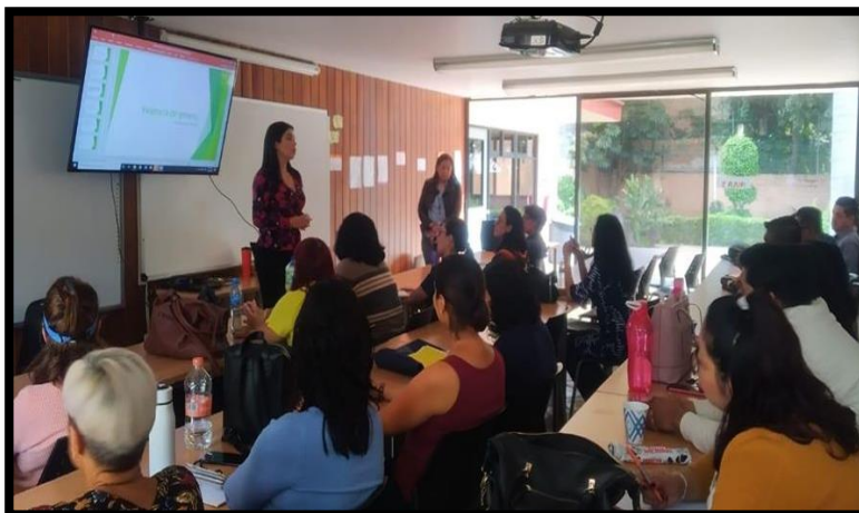
Centro de Lenguas, Centro

El mismo día 23 de enero de la presente anualidad, se continuo con las Jornadas Informativas sobre Derechos Académicos y Humanos de la Procuraduría de los Derechos Académicos de la UAEM, en la Preparatoria Cuautla.