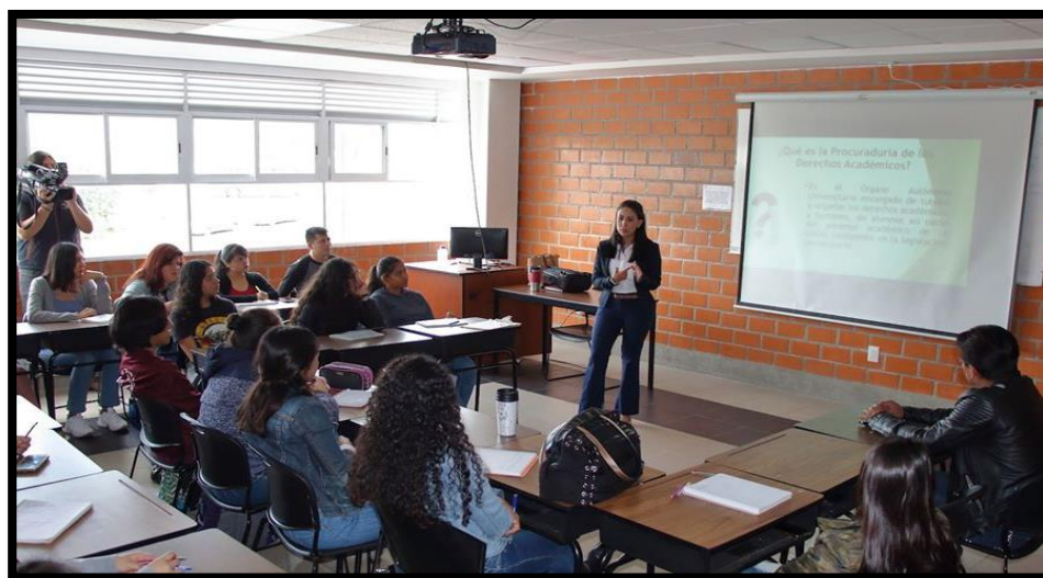
Facultad de Psicología

de Morelos, iniciaron las Jornadas de Información sobre el quehacer de estas dependencias universitarias, en las facultades y centros de investigación dirigidas a los estudiantes.