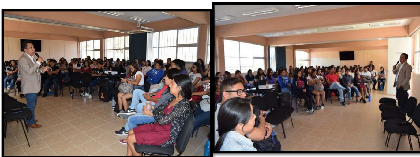
Facultad de Estudios Sociales de Temixco