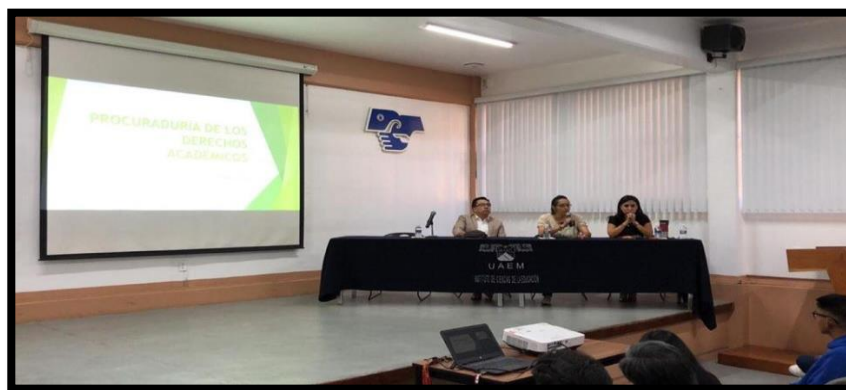
Instituto de Ciencias de la Educación