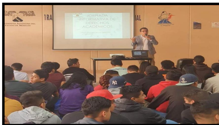
Facultad de Ciencias del Deporte